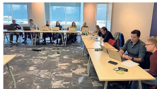
Experts beantwoorden vragen tijdens het jaarlijkse zorgspreekuur.